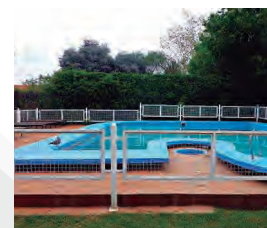
HOTEL CLIMA SOL