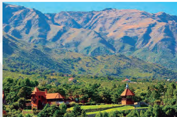
MERLO - SAN LUIS