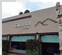
HOTEL CLIMA SOL