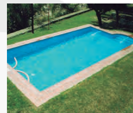
HOTEL PALACE - PISCINA